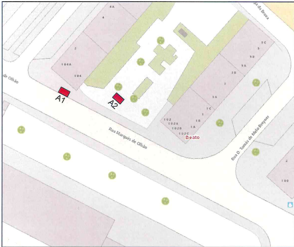
Planta de Localização