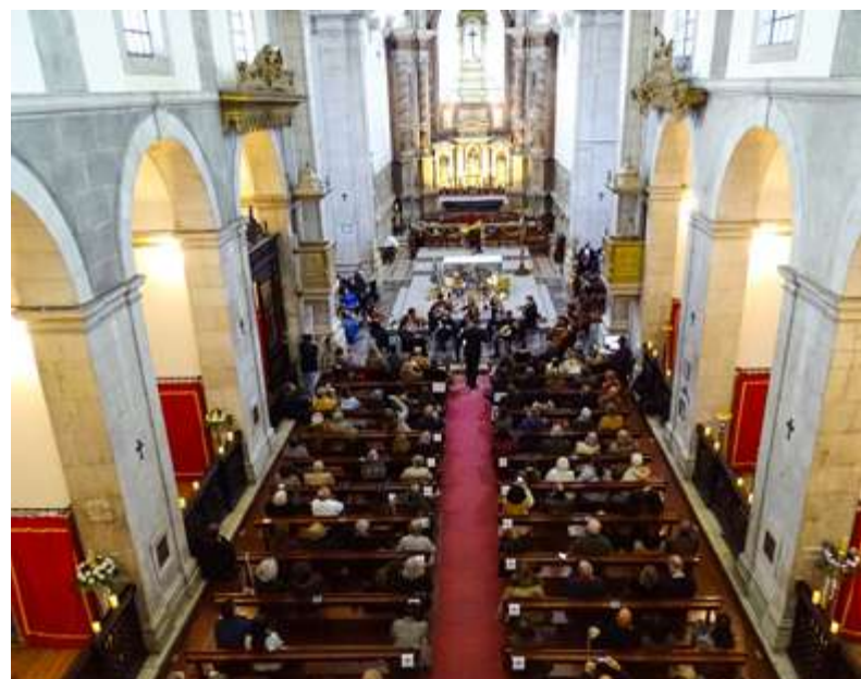
Ouviram-se temas originais, temas de música clássica e clássicos de Natal.