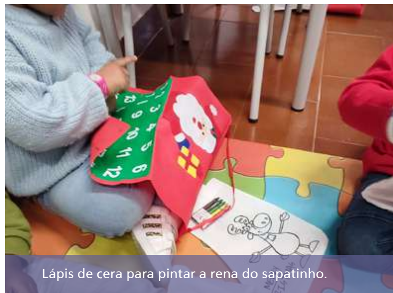
Lápis de cera para pintar a rena do sapatinho.