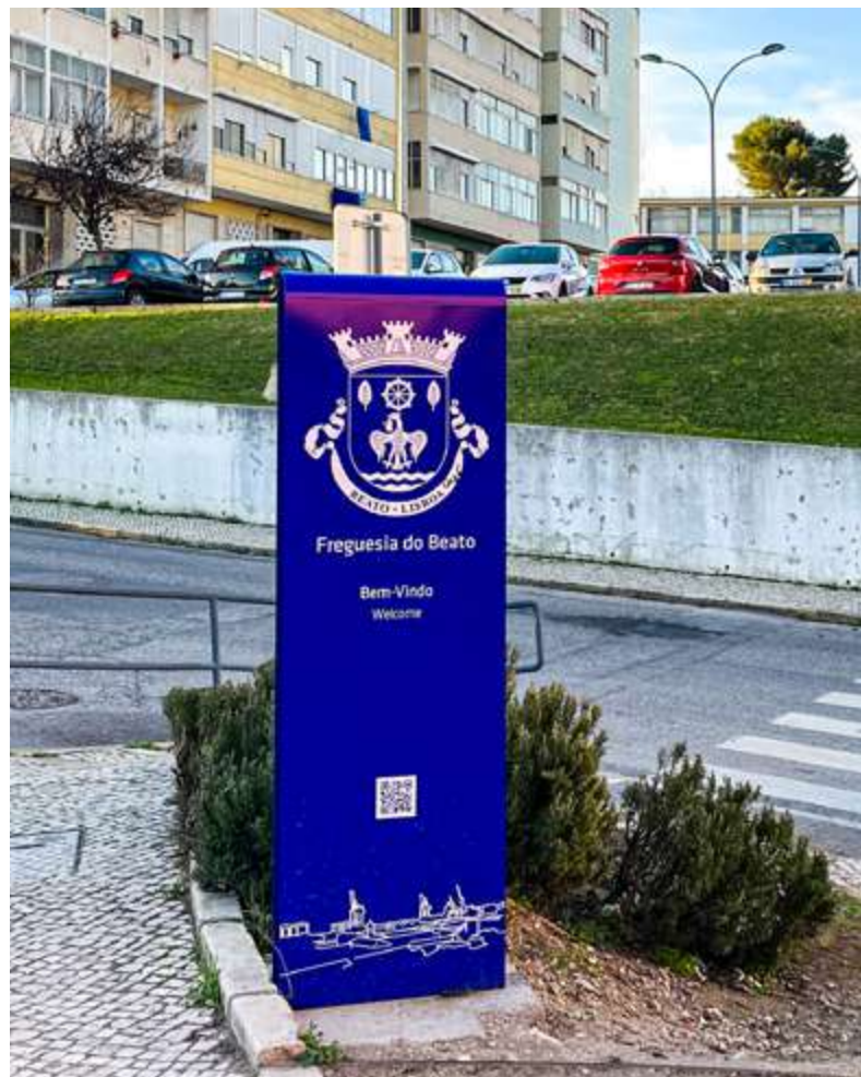
Novos marcos nos limites da freguesia.