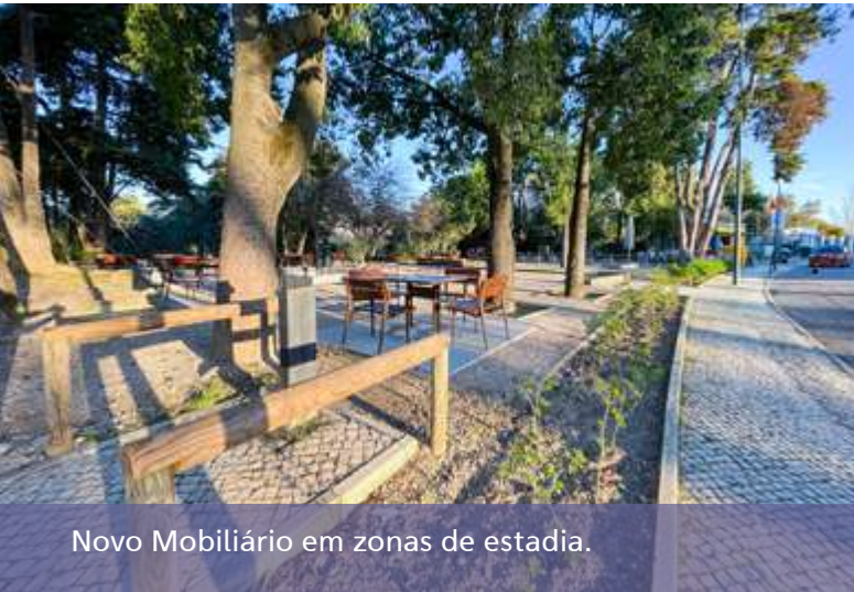
Novo Mobiliário em zonas de estadia.