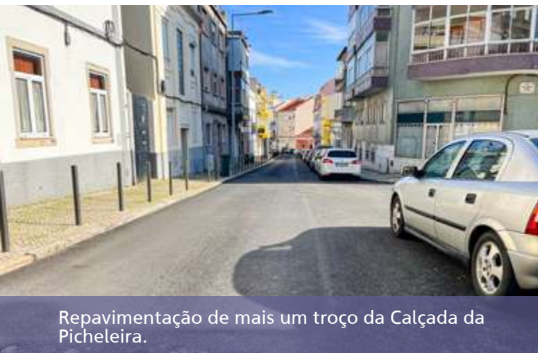
Repavimentação de mais um troço da Calçada da Picheleira.

promover intervenções nos bairros e áreas envolventes que visam uma manutenção cuidada e segura do espaço público, de espaços pedonais e zonas de fruição e lazer e que melhorem a mobilidade e a coesão de todo o território da freguesia.✿