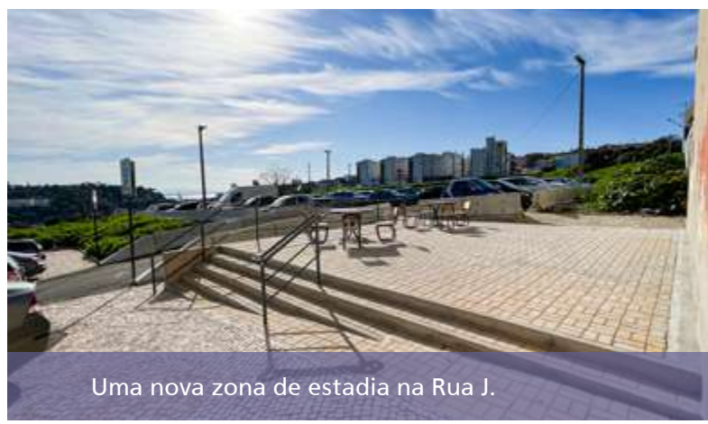
Uma nova zona de estadia na Rua J.