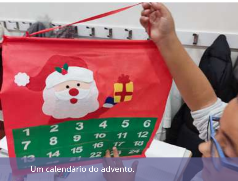
Um calendário do advento.

Beato (Manutenção Militar) e na distribuição de presentes, contando com o sorriso, a animação e o entusiasmo dos miúdos que, cada vez mais, precisam destes momentos de felicidade e alegria, em que podem ser apenas crianças. ❄️