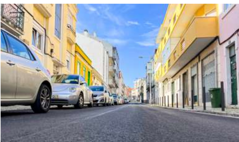
A Calçada da Picheleira é uma das mais emblemáticas ruas da freguesia.