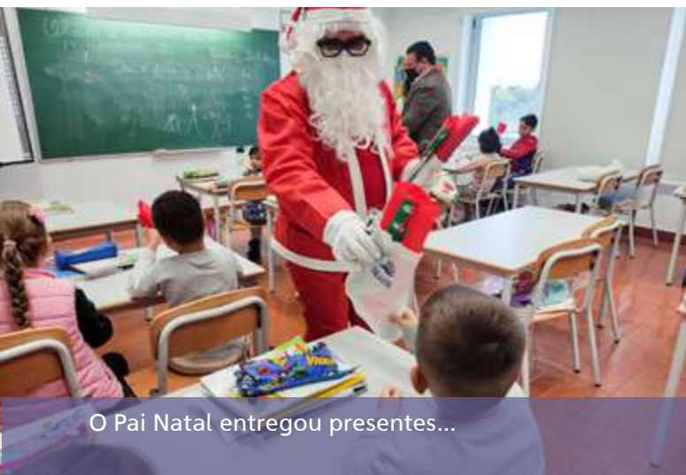
O Pai Natal entregou presentes...