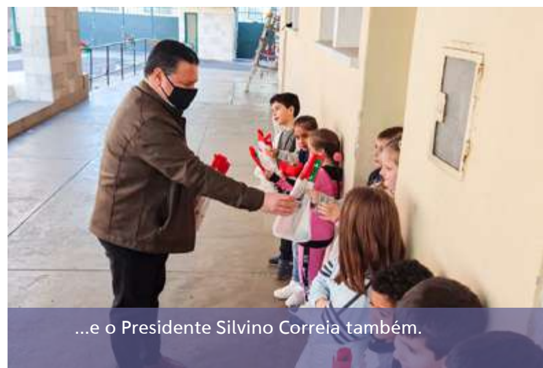
...e o Presidente Silvino Correia também.