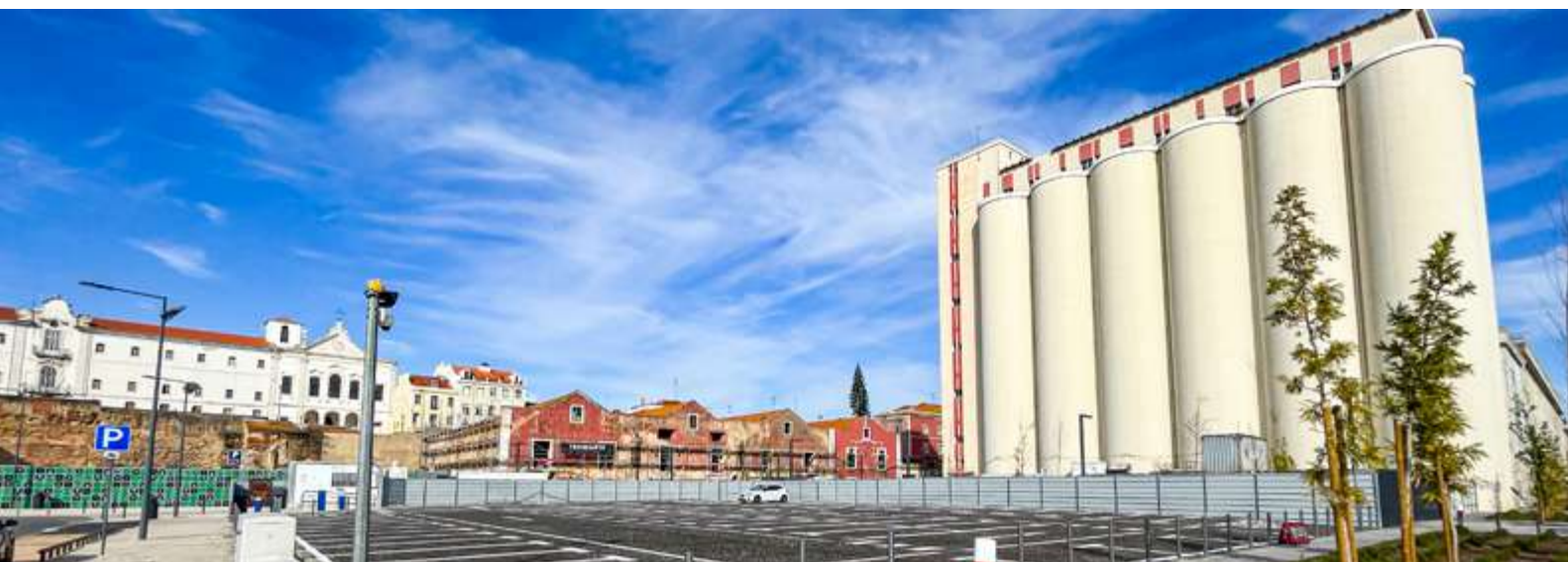
Novo parque de estacionamento da EMEL entre a AV. Infante D. Henrique e a R. da Manutenção.