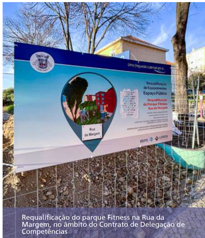
Requalificação do parque Fitness na Rua da Margem, no âmbito do Contrato de Delegação de Competências