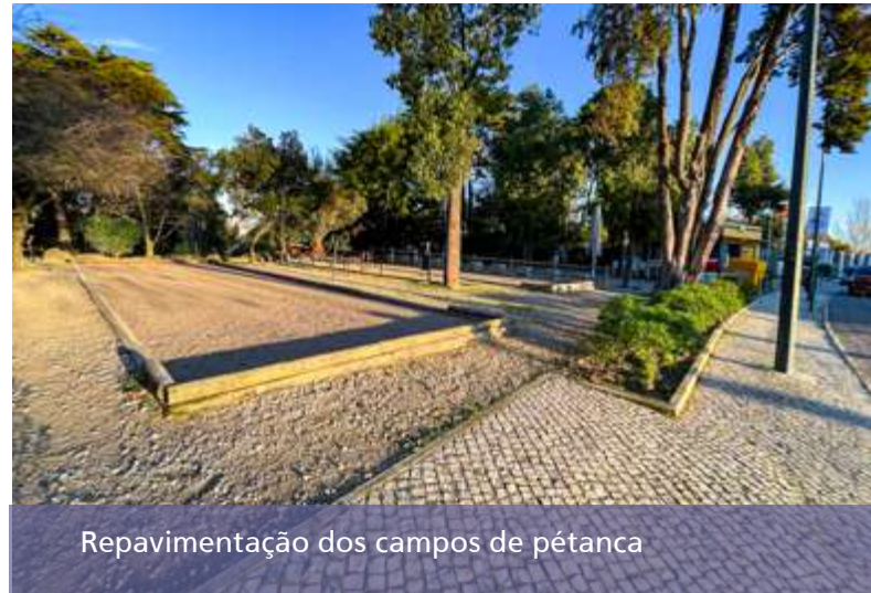
Repavimentação dos campos de pétanca

a CML, e num enquadramento particularmente exigente para a execução de qualquer obra ou projeto devido aos efeitos da pandemia e da crise global das matérias-primas, a área do Espaço Público da Junta já planeou e projetou diversas obras finan-