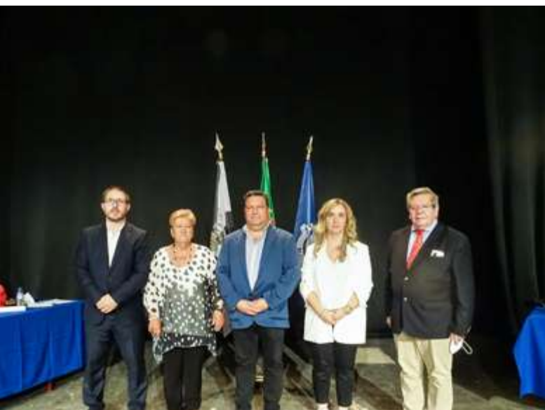
Executivo da Junta de Freguesia

Na freguesia do Beato, a escolha dos representantes autárquicos locais foi exercida por 4 868 eleitores num total de 10 431 eleitores