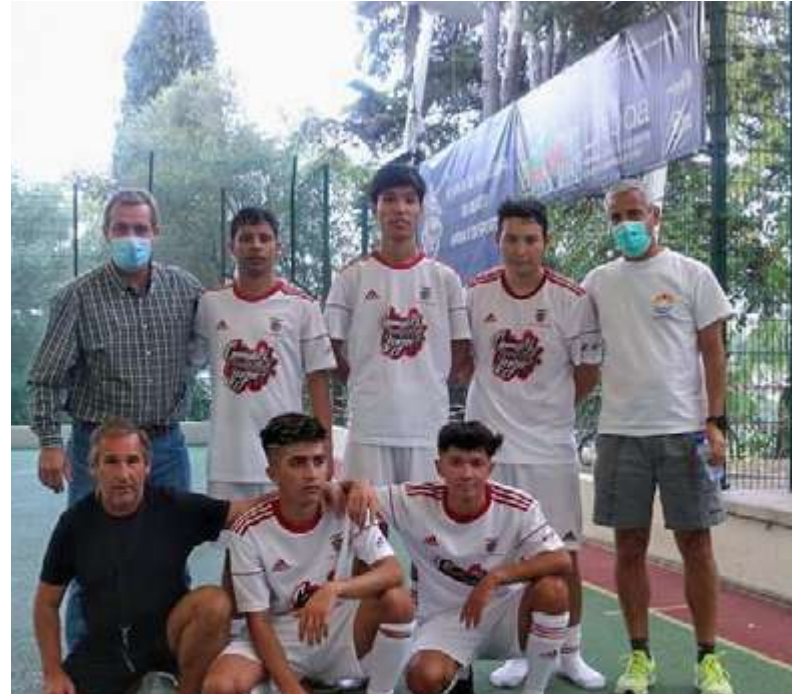
A equipa dos Young Birds United, constituída por jovens refugiados Afegãos.

S olidariedade, Fraternidade, Fair-Play e bom futebol. Foram estes os motes para mais uma jornada da Community Champions League (CCL) no Beato.