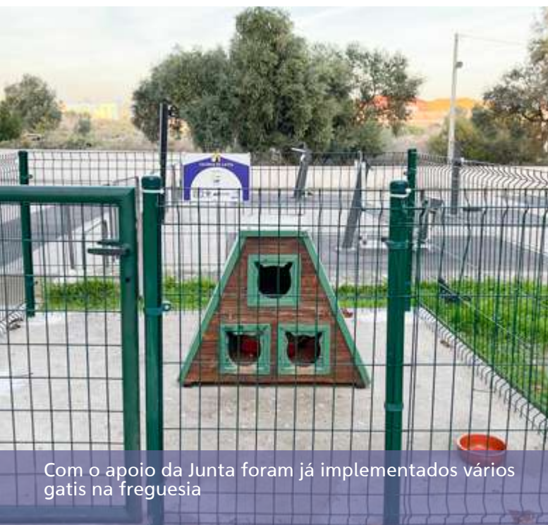
Com o apoio da Junta foram já implementados vários gatis na freguesia