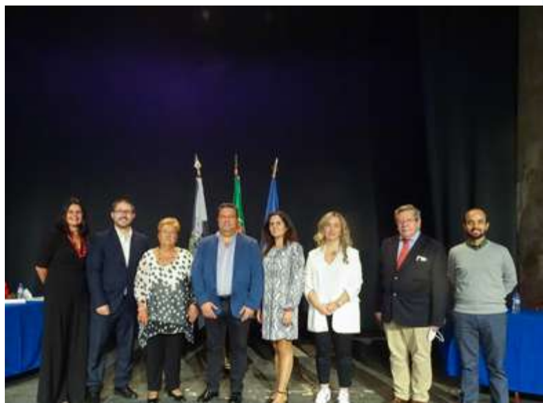
Executivo da Junta de Freguesia e a Mesa da Assembleia