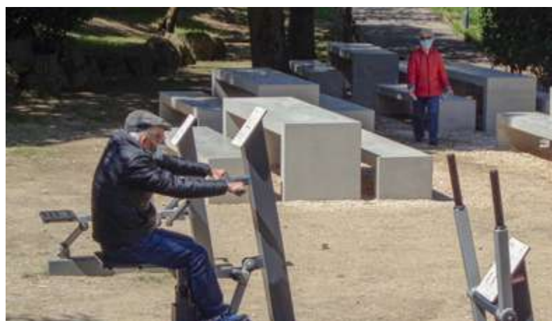
Novas mesas e bancos no Parque de Merendas da Mata da Madre de Deus