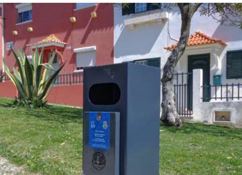
Novos caixotes com dispensadores de sacos para dejetos caninos