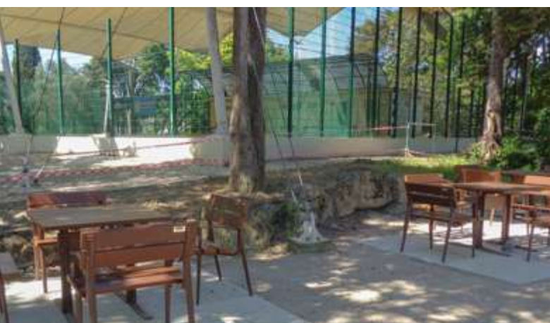
Novas mesas e bancos e para jogos de mesa e confraternização

Por toda a freguesia têm sido várias as intervenções executadas tanto no âmbito dos Contratos de Delegação de Competências como por cabimentação própria, nomeadamente em questões da mobilidade, da ação social, infância e juventude, comércio local e outros. ❄