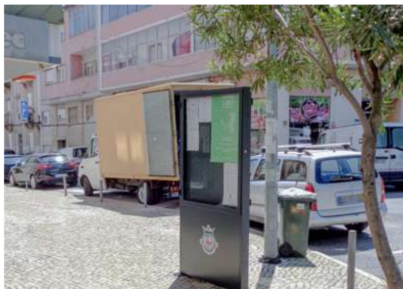
Novas vitrines para divulgações do interesse da população