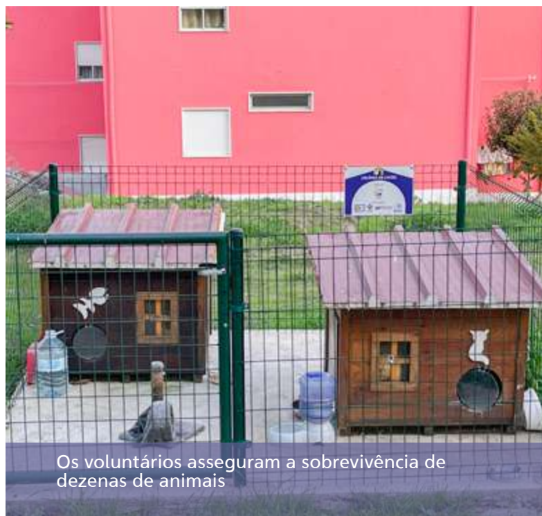
Os voluntários asseguram a sobrevivência de dezenas de animais