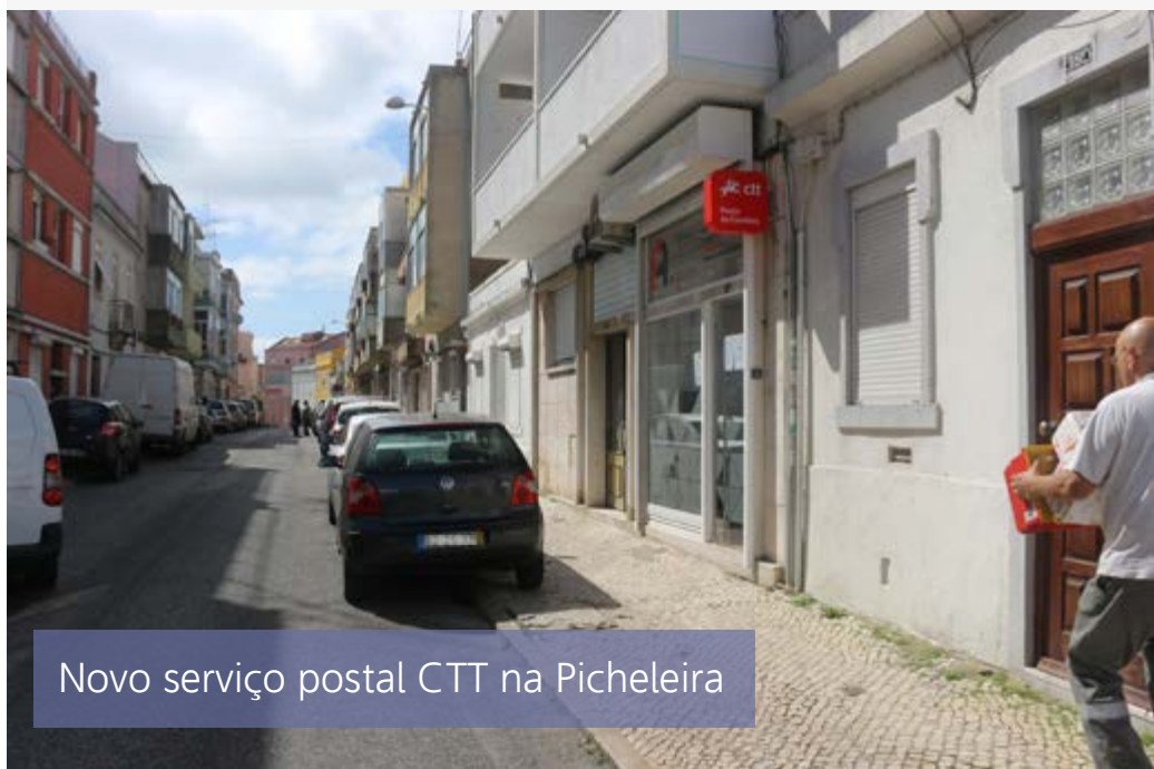
Novo serviço postal CTT na Picheleira

No seguimento da rua do Mercado, já na Calçada do Carrascal, está agora também disponível uma loja que assegura o serviço postal dos CTT e que serve convenientemente a população da zona. ❄