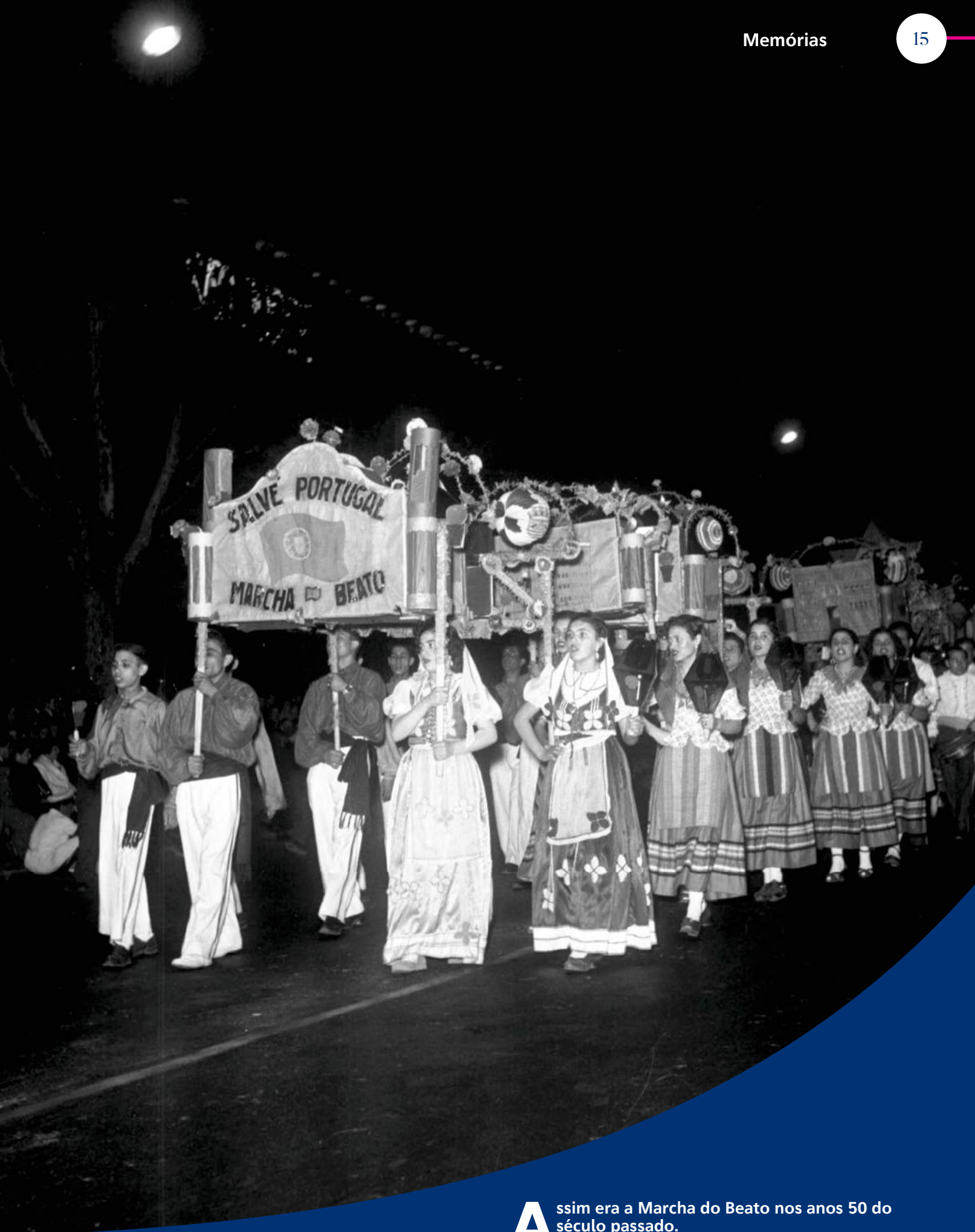
Marcha Popular do Beato 1950

A ssim era a Marcha do Beato nos anos 50 do século passado. As Marchas de Lisboa remontam ao ano de 1932, sendo hoje, a par com os Santos Populares, umas das mais antigas tradições da cultura popular da nossa cidade.