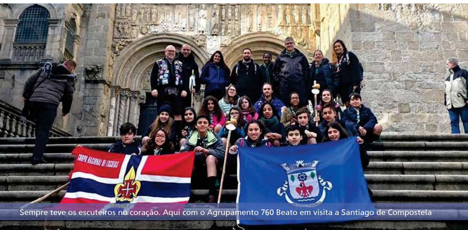
Sempre teve os escuteiros no coração. Aqui com o Agrupamento 760 Beato em visita a Santiago de Compostela

para as Juntas de Freguesia, dos últimos anos houve um crescimento muito grande do número de funcionários da Junta de Freguesia, que resultou na sobrelotação do espaço (alugado) em Xabregas, no qual a Junta do Beato está instalada há já vários anos, resultando de uma grande preocupação de todo o Executivo que tem, junto da C.M.Lisboa, desenvolvido diligências para a procura de novo local adequado e capaz de albergar nomeadamente todos os serviços administrativos. Para o imediato e para colmatar a necessidade de espaço, estamos a adaptar o antigo espaço dos reformados localizado na Rua Nova do Grilo ao lado do Espaço Saúde e ainda de uma outra loja cedida pela C. M. L. no mesmo local para instalarmos alguns dos serviços técnicos da Junta, e assim proporcionarmos melhores condições de trabalho aos nossos funcionários. 🌀