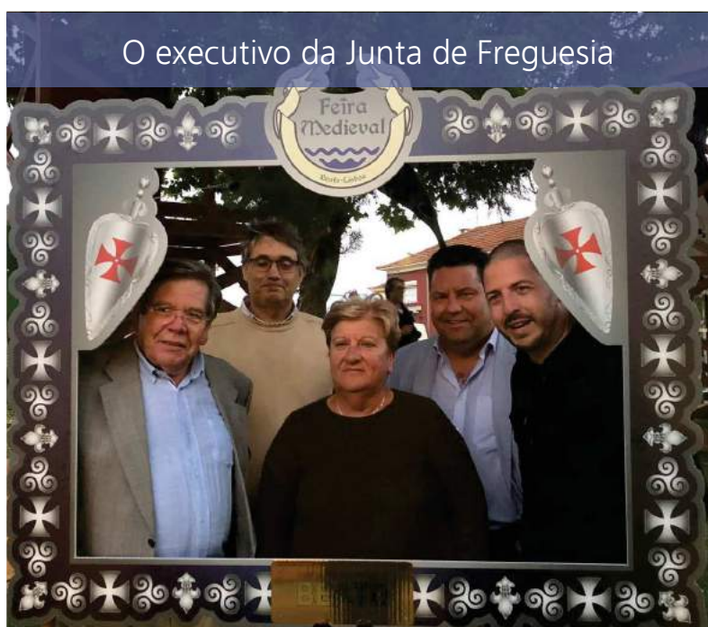
O executivo da Junta de Freguesia