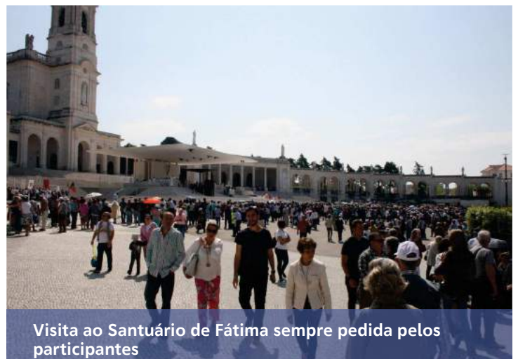
Visita ao Santuário de Fátima sempre pedida pelos participantes