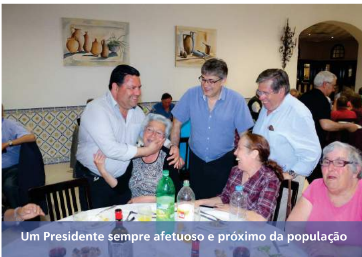
Um Presidente sempre afetuoso e próximo da população

O grupo seguiu de Lisboa em dez autocarros, acompanhados por uma ambulância do corpo de Bombeiros Voluntários do Beato disponível, durante todo o passeio, para qualquer eventualidade. Distribuídos por todos os autocarros, sempre em contacto com a população encontravam-se todos os membros do Executivo, vários Técnicos e Assistentes da Junta de Freguesia apoiados pelo Grupo de Voluntários da Proteção Civil Local. ❄️