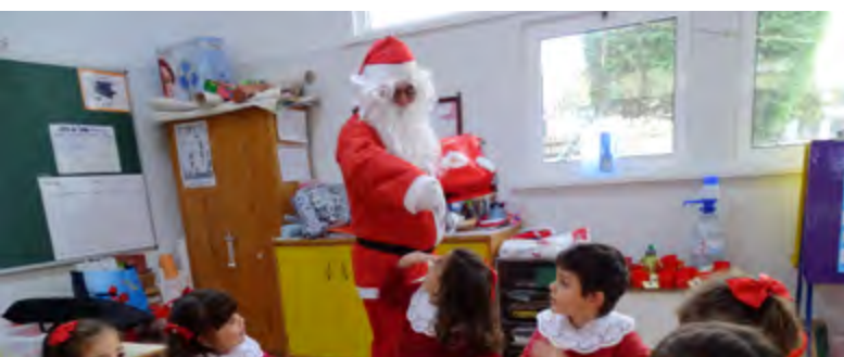
O Pai Natal do Beato interage com as crianças em momentos de felicidade e alegria.