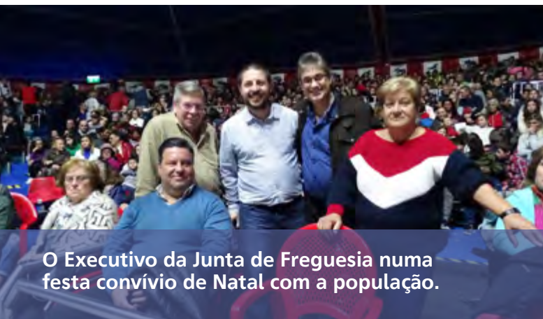
O Executivo da Junta de Freguesia numa festa convívio de Natal com a população.

foi um momento da expressão de união desta comunidade que não deixou de nos manifestar o profundo agrado com que passaram uma tarde com boa disposição e em comunhão com os vizinhos de toda a freguesia. ❄️