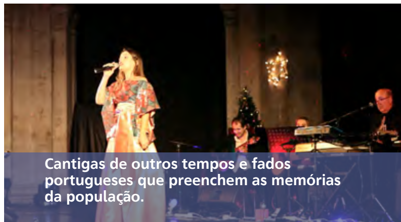
Cantigas de outros tempos e fados portugueses que preenchem as memórias da população.

eventos que têm merecido os sorrisos e palavras de reconhecimento dos beatenses e estes são, sem dúvida, os melhores presentes de Natal que podemos receber. ❄️