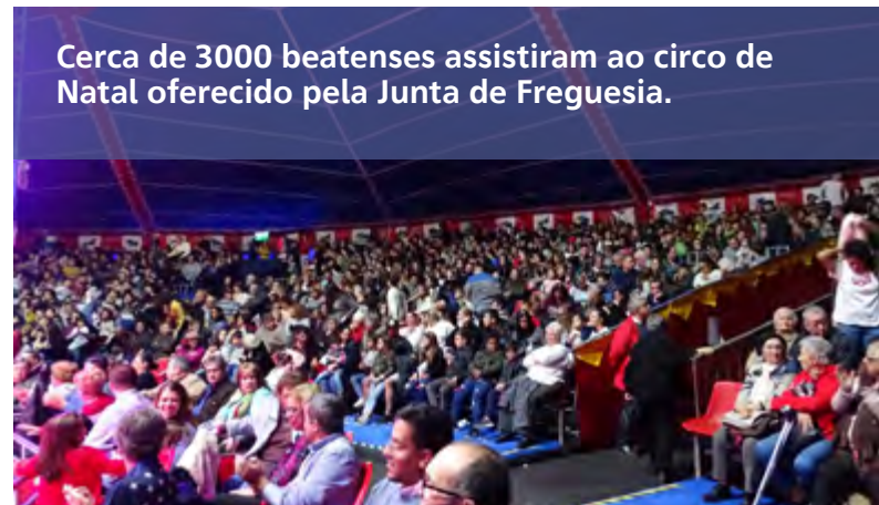
Cerca de 3000 beatenses assistiram ao circo de Natal oferecido pela Junta de Freguesia.

O circo é um espetáculo que une gerações e marca o imaginário de tantos de nós, proporciona sorrisos, gargalhadas e enche-nos de alegria.