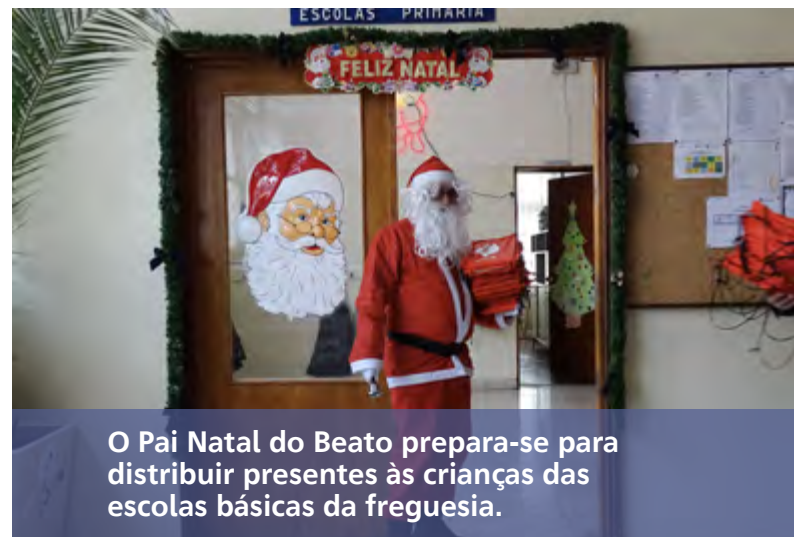
O Pai Natal do Beato prepara-se para distribuir presentes às crianças das escolas básicas da freguesia.