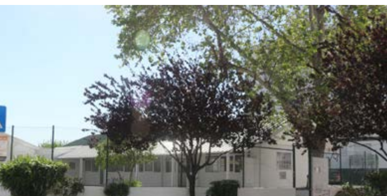
Acompanhamento escolar, por monitores licenciados e preparação para os testes e exames. Nas interrupções letivas, oferece atividades que complementam a formação dos nossos jovens