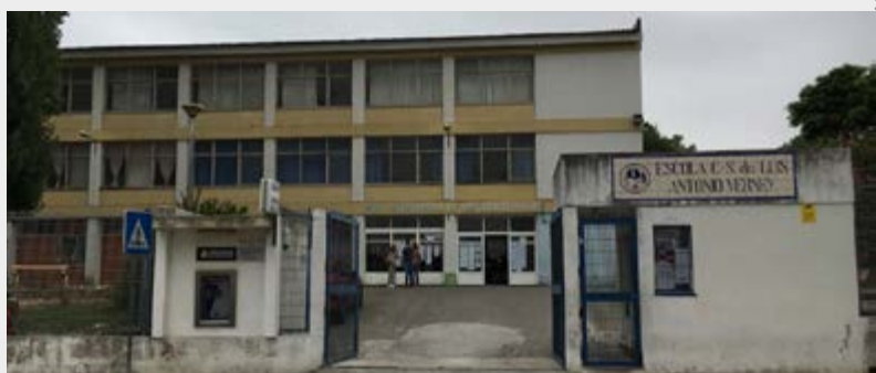
Escola EB 2/3 Luís António Verney