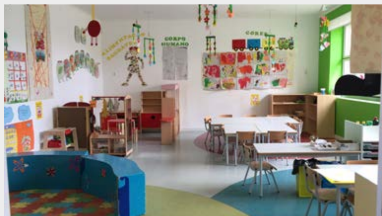
Já prometidos pela Câmara novos equipamentos no Beato para alargar a oferta de Creche

É pretensão da Junta de Freguesia que o número de vagas seja alargado, estando já prometidos, pela Câmara, projetos para a construção de novos equipamentos no Beato que permitirão acolher espaços com capacidade para alargar a oferta, nesta fase, ao nível de creche para crianças até aos 3 anos de idade. ❄