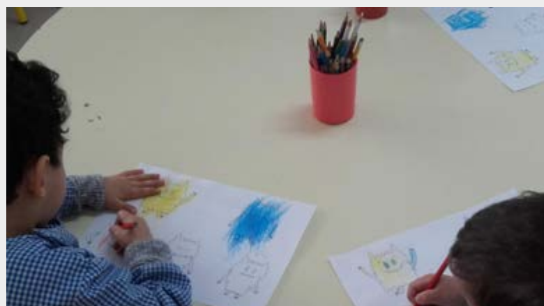
Inserido em contexto letivo, a Junta de Freguesia proporciona intervenções em contexto de sala, com atividades dinâmicas que assumem um papel fundamental na formação das crianças